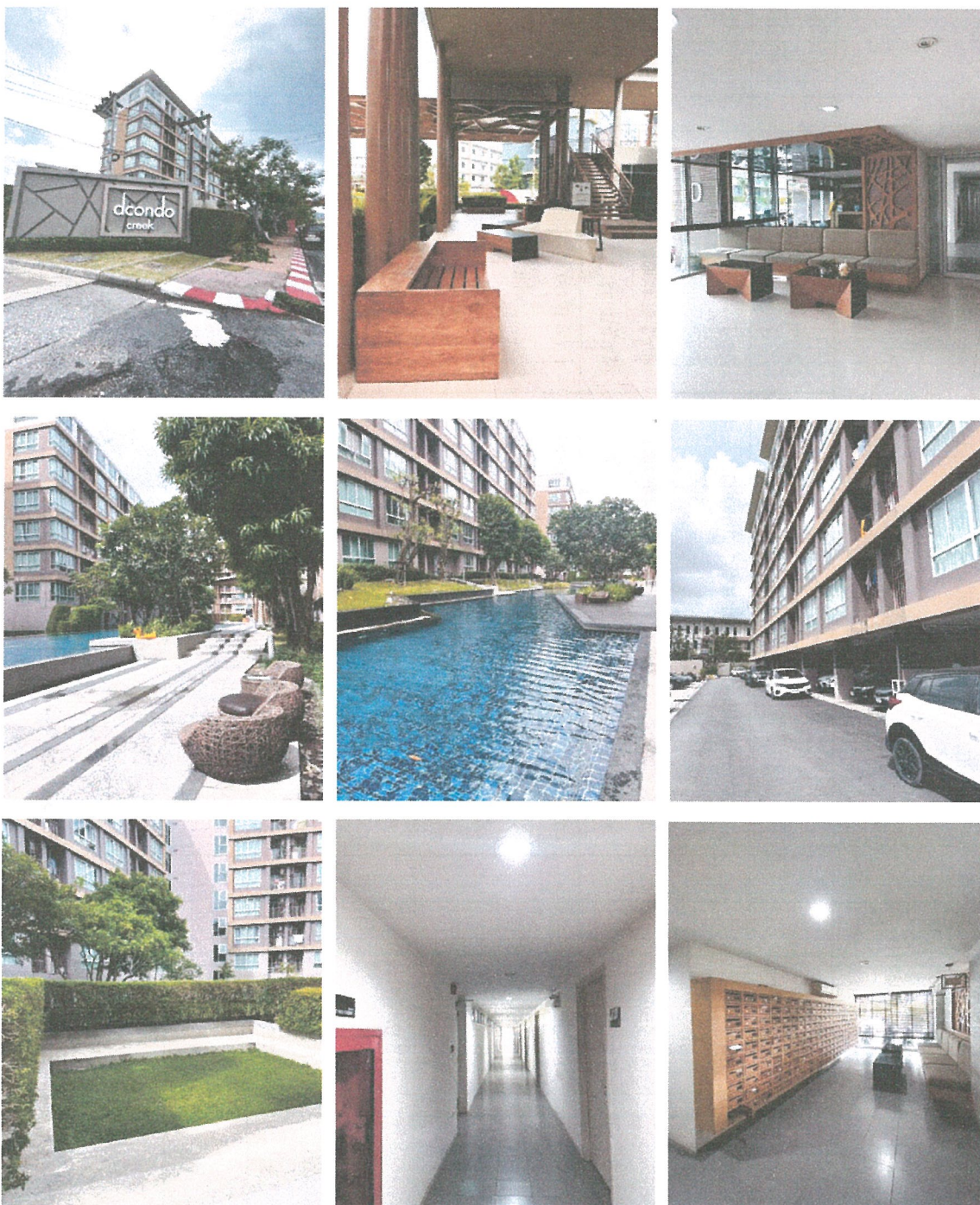
รูปภาพที่ 1.4 การใช้พื้นที่อาคาร

ระยะดำเนินการ ระหว่างเดือนมกราคม - มิถุนายน 2566