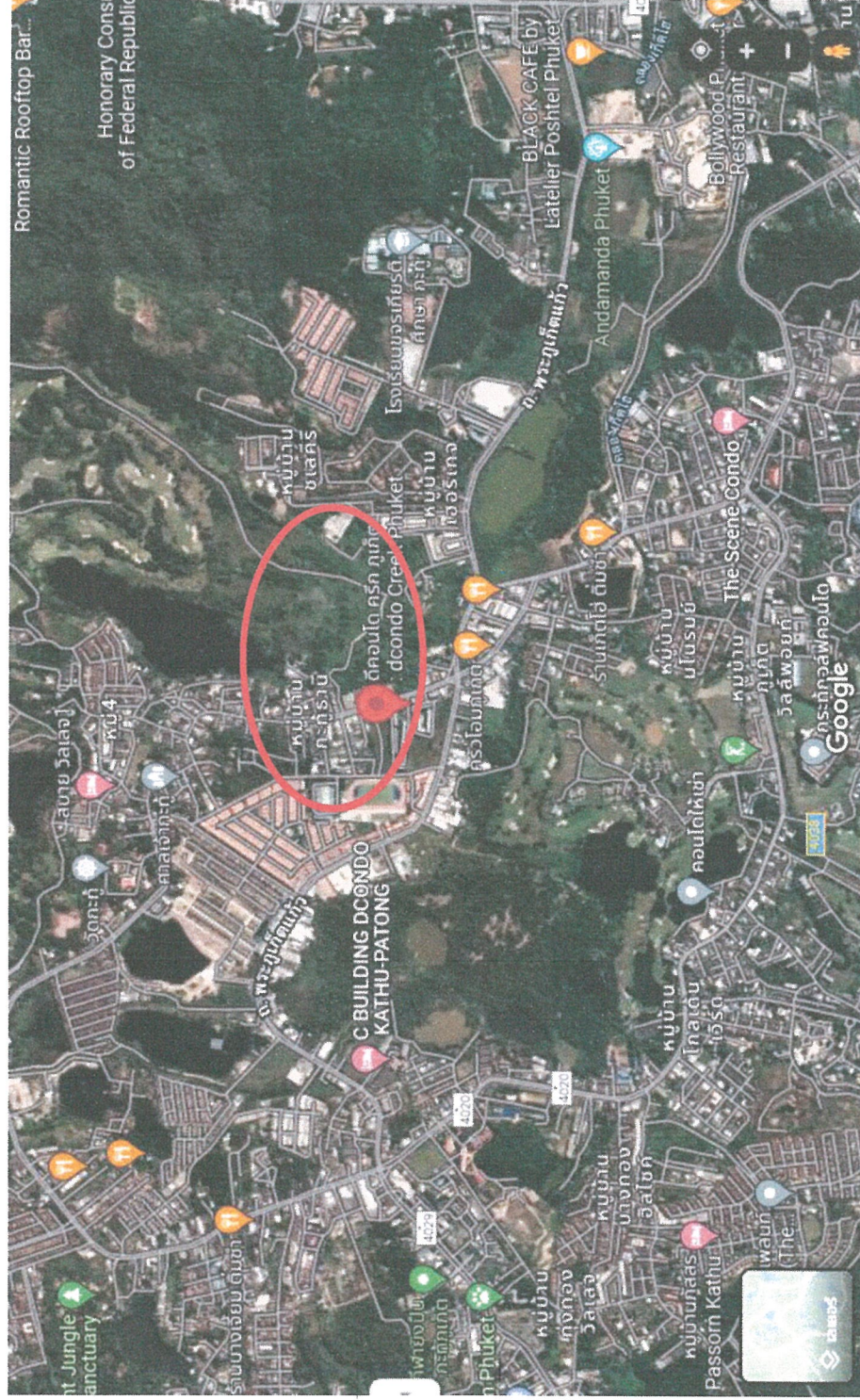
รูปภาพที่ 1.1 แผนที่ตั้งของโครงการ ดี คอนโด ศรีภ (Top view)